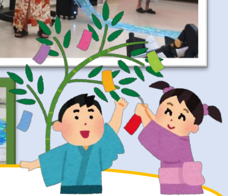
短冊に願い事を書きました！