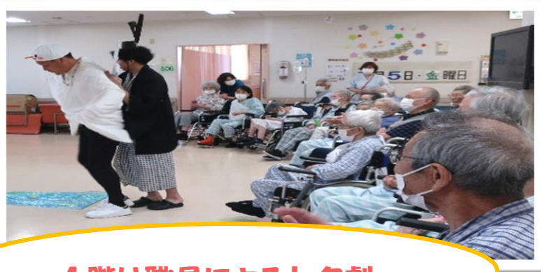
4階は職員による七夕劇☆