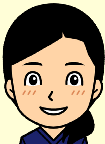
リハビリ かんばら